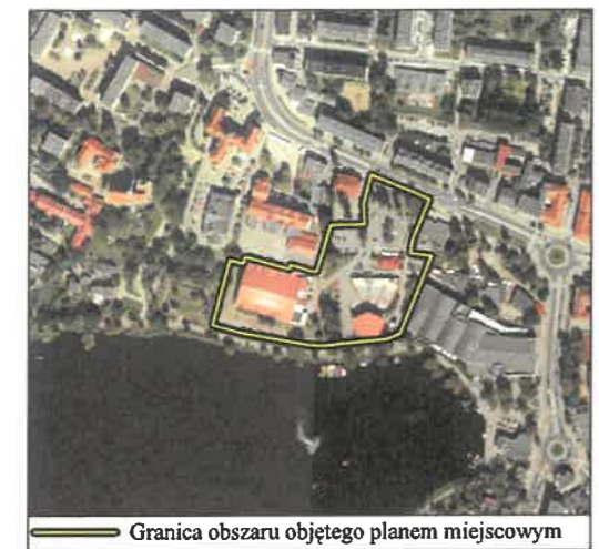
Granica obszaru objętego planem miejscowym