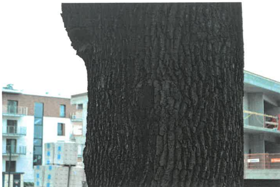
Fot. 3 Pozostałości po tabliczce wiszącej na drzewie.