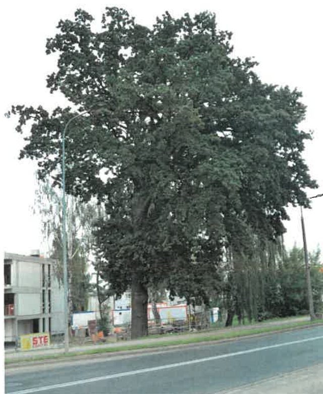
Fot. 4 Dąb Strażak