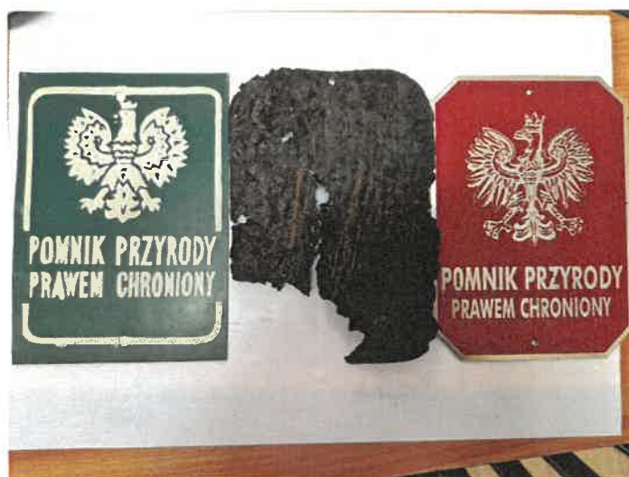
Fot. 2 W środku tabliczka znaleziona na drzewie podczas oględzin.