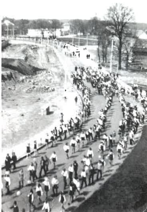
Fot. 1 Pochód pierwszomajowy, rok 1964. Po prawej stronie widać "Strażaka".